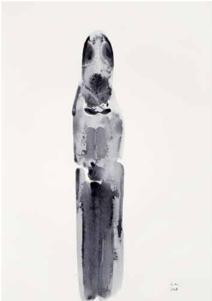
SANS TITRE METAMORFOSES I, 2018 Gomme-laque s/ papier Dim. : 42,0 x 30,0 cm